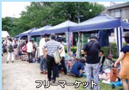
フリーマーケット