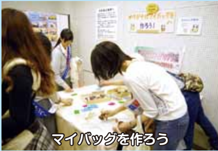
マイバッグを作ろう