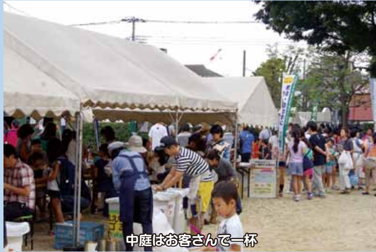
中庭はお客様で一杯