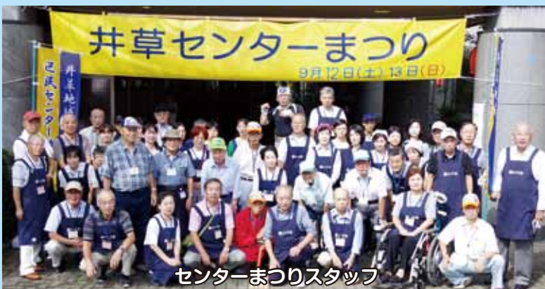
センターまつりスタッフ