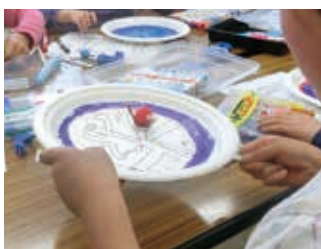
回っておどるマスコット