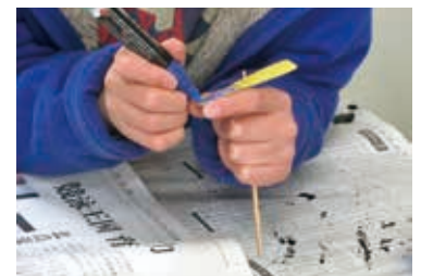
よく飛ぶ竹とんぼを作ろう