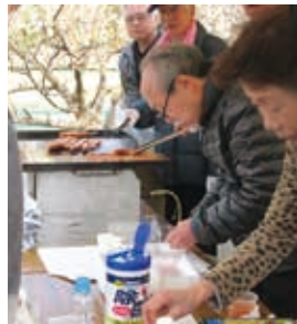
フランクフルト販売