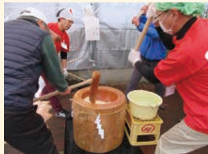
おろしたての白でおもちつき