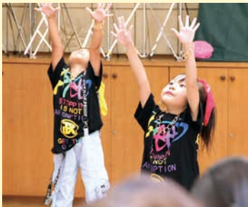
ストリートダンス