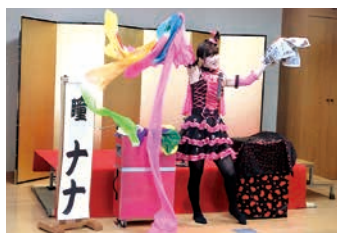
1月 新春いぐさ演芸会