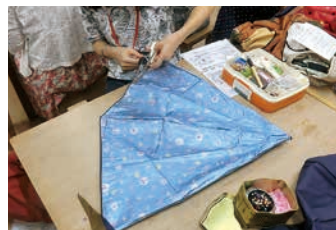
7月 こわれた傘の布から手ぬいで 作る自転車かごカバー