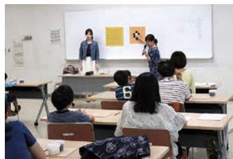
6月 親子の囲碁教室