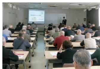
3月 防災会との協働事業