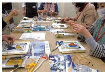
2月 ステンドグラスで オーナメント作り