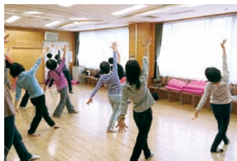
5月 ストレッチ&筋トレで キレイな姿勢に!