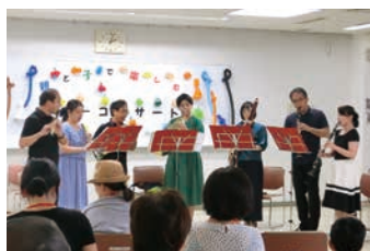
8月 親子で楽しむ サマーコンサート