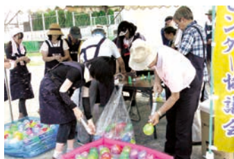
7月 支援事業 四宮小盆踊り ヨーヨーつり