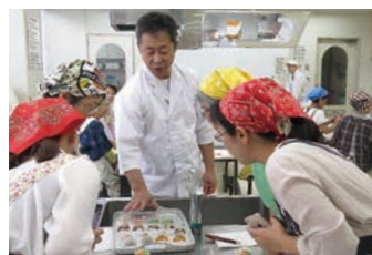
10月 和菓子を作って 抹茶とともに