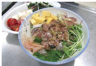
4月 鱈の三枚おろしと 健康ランチ