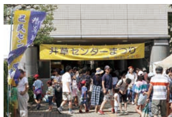
9月 センターまつり