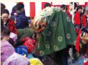
上井草もちつき大会