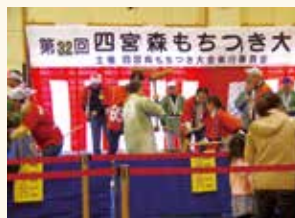
四宮森もちつき大会