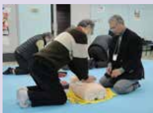
「立川防災館見学と『東京防災』勉強会」