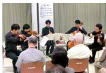
日本フィルハーモニー交響楽団室内楽コンサートと防犯のお話