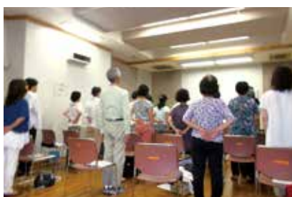
ボイストレーニングでリフレッシュ