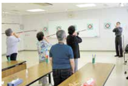
初心者スポーツ吹き矢教室