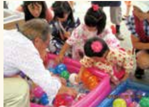
四宮小こども盆踊り