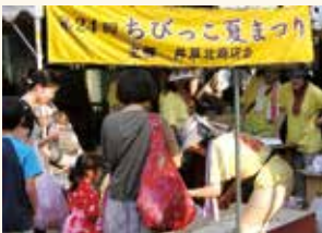
井草北商店会 「ちびっこ夏まつり」