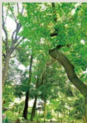
248号 下井草いこいの森