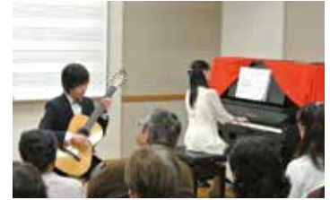
クラシックギター演奏会