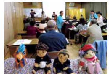
人形を作って、使って楽しい 腹話術