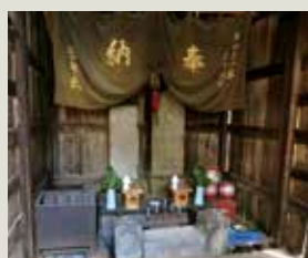
257号 旧早稲田通りの庚申塔