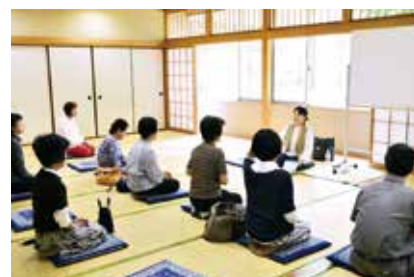
心を落ち着かせるコツを 学びましょう