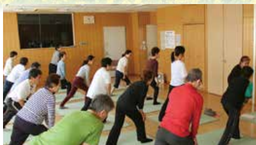
ストレッチでリフレッシュ