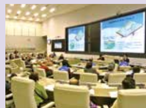
「東京都庁防災センター見学と防災勉強会」