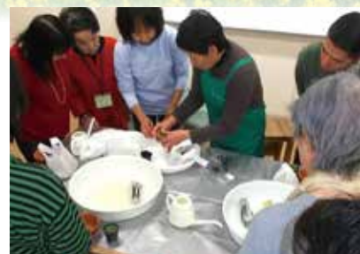
山野草を育てましょう