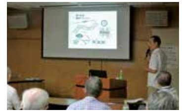
「海で何が起きているのか」知ってビックリ!海と魚のお話