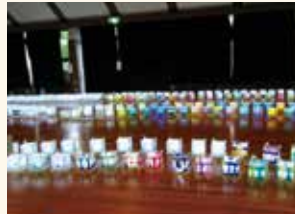
今川親和会 「灯りde絆」