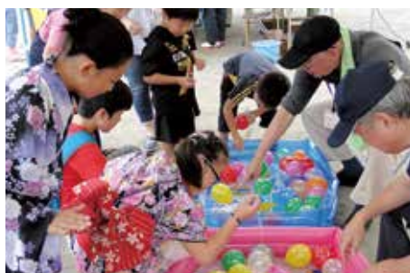
四宮小こども盆踊り