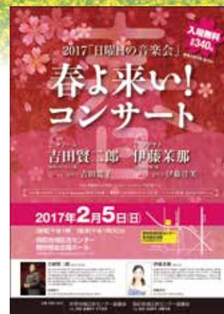
「春よ来い! コンサート」のポスター