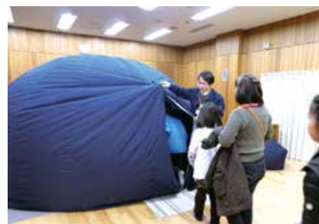
「プラネタリウムで星を見よう！ 天体望遠鏡を作ろう!」