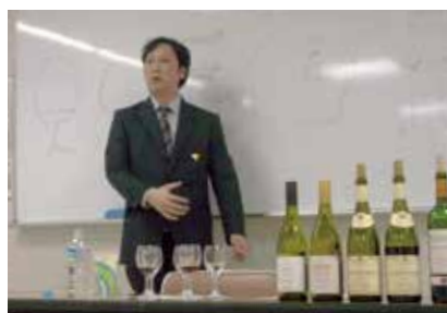
初歩のワイン講座