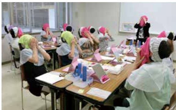
いきいき美容教室