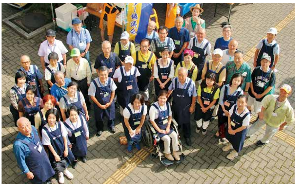
平成28年9月センターまつり

委員は原則として井草地域の住民から選出され、公募委員と井草地域の団体（町会・自治会、商店会、小学校PTA、中学校PTA、青少年団体、高齢者団体、障害者団体、青少年育成委員会、消費者団体、労働団体、青少年委員、スポーツ推進委員、民生児童委員）から推薦された委員で構成されています。