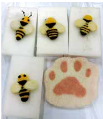
羊毛フェルトでオリジナルブローチを作ろう