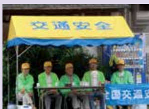
井草1・2丁目自治会