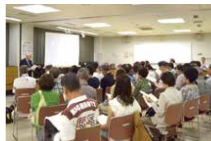
歌舞伎の魅力～俳優の世界