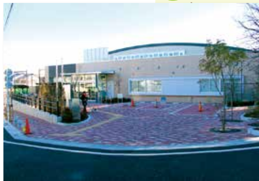
改築された妙正寺体育館