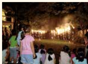
東原児童館 「お庭DEキャンプ」