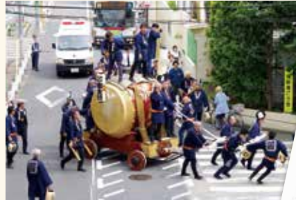
井草八幡宮・太鼓祭り