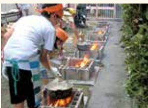
下井草児童館 「お泊り探検隊」