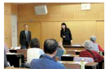
一度は聞いておこう遺言・相続・成年後見の話