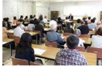
ヨーロッパと日本 ～食の違い～