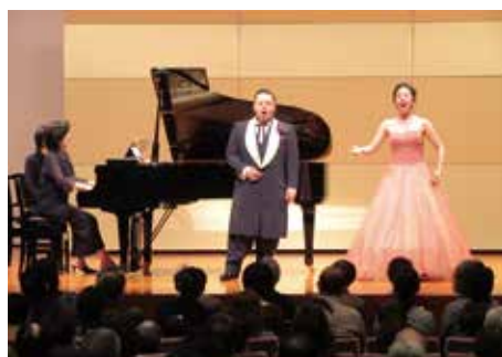
「春よ来い! コンサート」