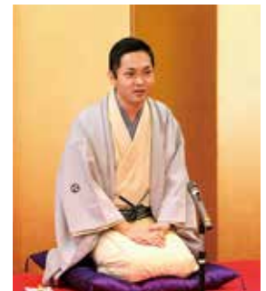
新春いぐさ演芸会