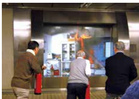
「立川防災館見学と『東京防災』勉強会」