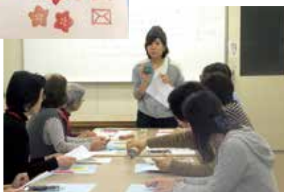
消しゴムはんこを作ろう