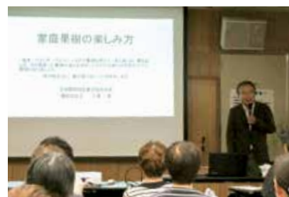
家庭果樹の楽しみ方