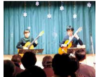
クラシックギターデュオによる 楽しいクリスマスコンサート