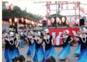
上井草商店街振興組合 「井草夏まつり」