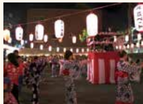
西武井荻商店街振興組合 「納涼盆踊り大会」