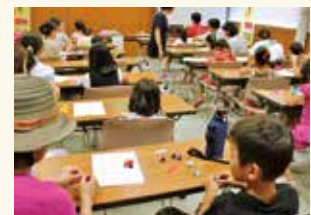
下井草図書館 「夏休み工作会」