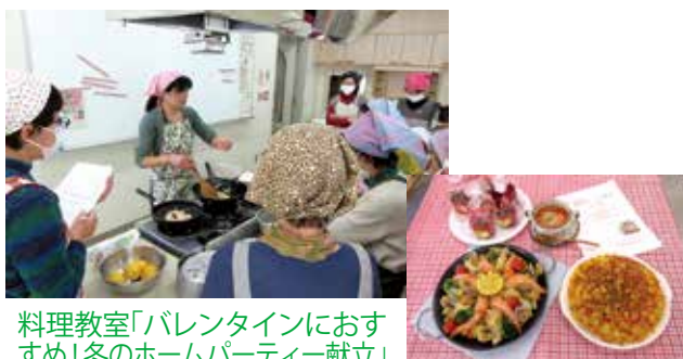
料理教室「バレンタインにおすすめ!冬のホームパーティー献立」