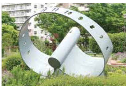
日時計ウォーキング第2弾