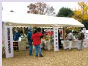
杉並区総合震災訓練