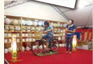
下井草商店街振興組合 「下井草サマーフェスティバル」