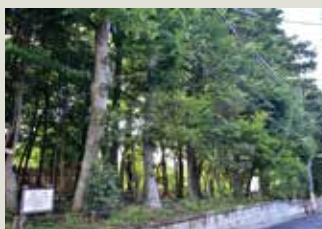
247号 清水いこいの森

広報紙「マイタウンいぐさ」にシリーズとして「井草の散歩道」コーナーを設け、地元の風物詩や風景、出来事などを掲載しました。