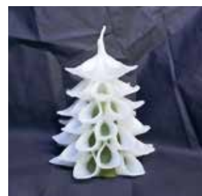
フレグランスツリーキャンドルを作ろう