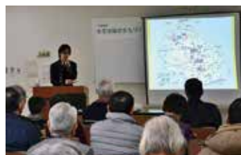
井草地域のまちづくり今昔