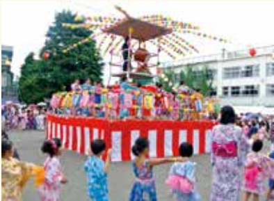
沓掛小くつけ祭り