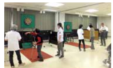
レクリエーション スポーツダーツを楽しむ