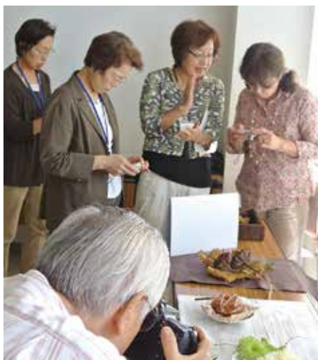
初心者の為の写真教室