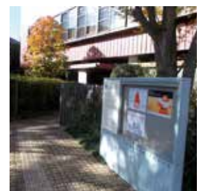
いわさきちひろの世界