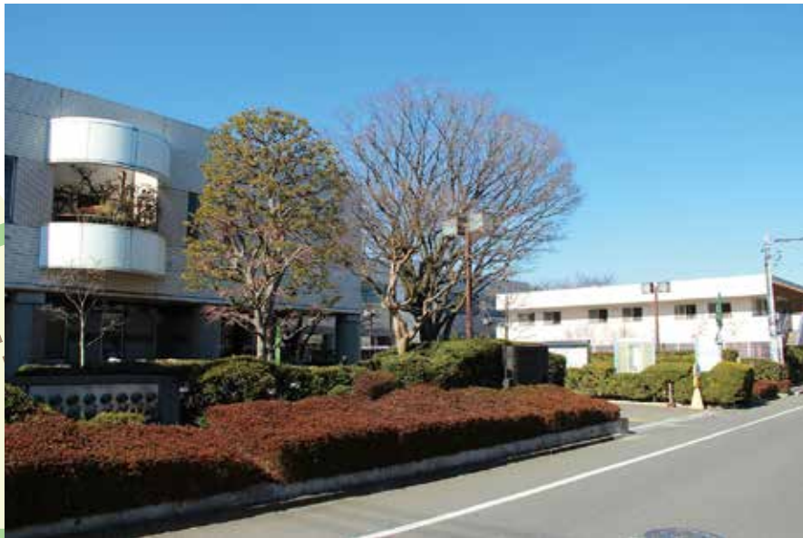
井草地域区民センター