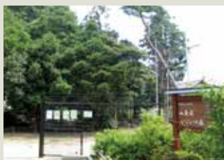
249号 山葉名いこいの森