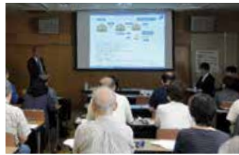
財産を守る賢い相続対策