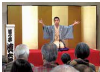
新春いぐさ演芸会