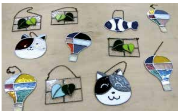
夏休み「親子ステンドグラス教室」