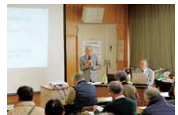
井草地域のまちづくり今昔