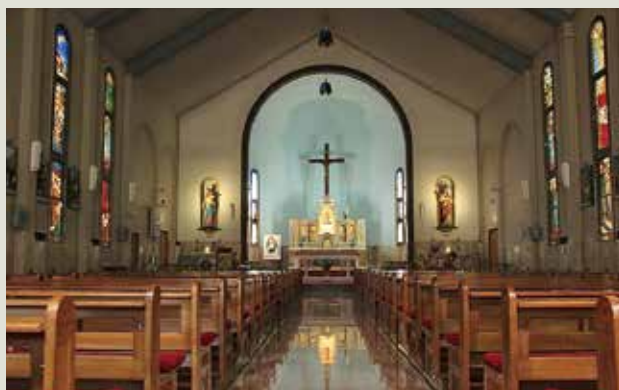
254号 下井草カトリック教会