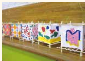
四宮森児童館 「あんどん作り」