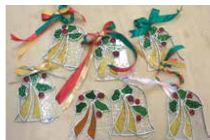
ステンドグラスでオーナメント作り