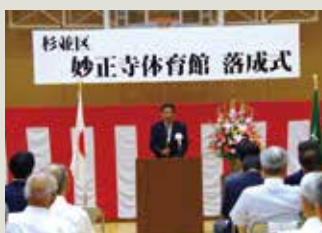
255号 妙正寺体育館 リニューアルオープン