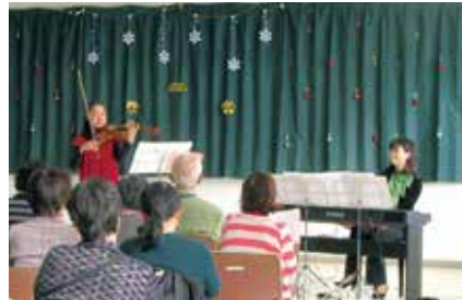
クリスマスアフタヌーンコンサート