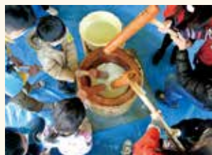
下井草もちつき大会