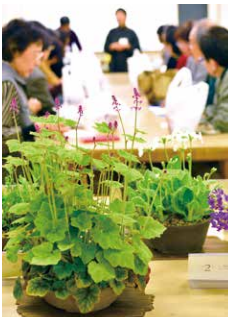
山野草を育てましょう