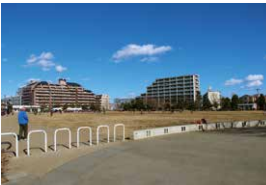
桃井はらっぱ公園