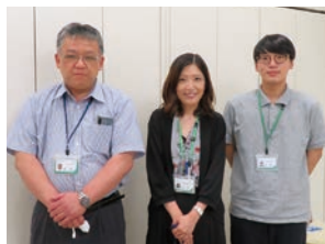
ごみ減量対策課の皆さん